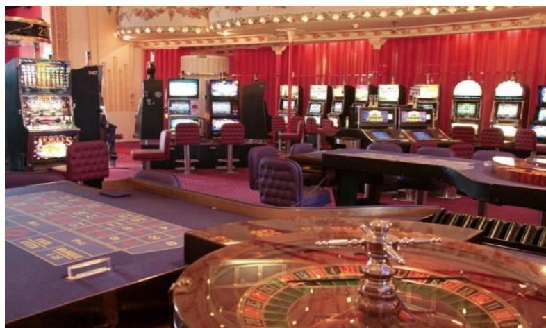
电子轮盘Roulette Electronique : 可通过屏幕多人同时下注!