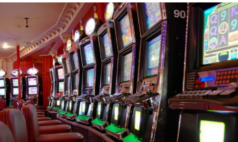
百万欧元大奖MEGAPOT : 法国得奖频率最高的百万大奖。

卡布尔娱乐场 Casino de Cabourg : 包括了角子机大厅, 传统游戏厅, 餐馆, 阳台, 酒吧等的综合博彩娱乐场所, 内部装饰为1900年的罗可可奢华风格。角子机大厅的75台滚轮和屏幕式角子机提供0.01欧元起的下注。传统桌上游戏每晚20点开始至凌晨2-3点: 电子轮盘, 德州扑克, 滚球, 轮盘, 欢迎来体验和测试您的运气。